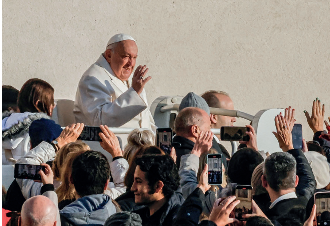
Papst Franziskus winkt den Gläubigen zu, als er am 4. Dezember 2024 zu seiner wöchentlichen Generalaudienz auf dem Petersplatz im Vatikan eintrifft.