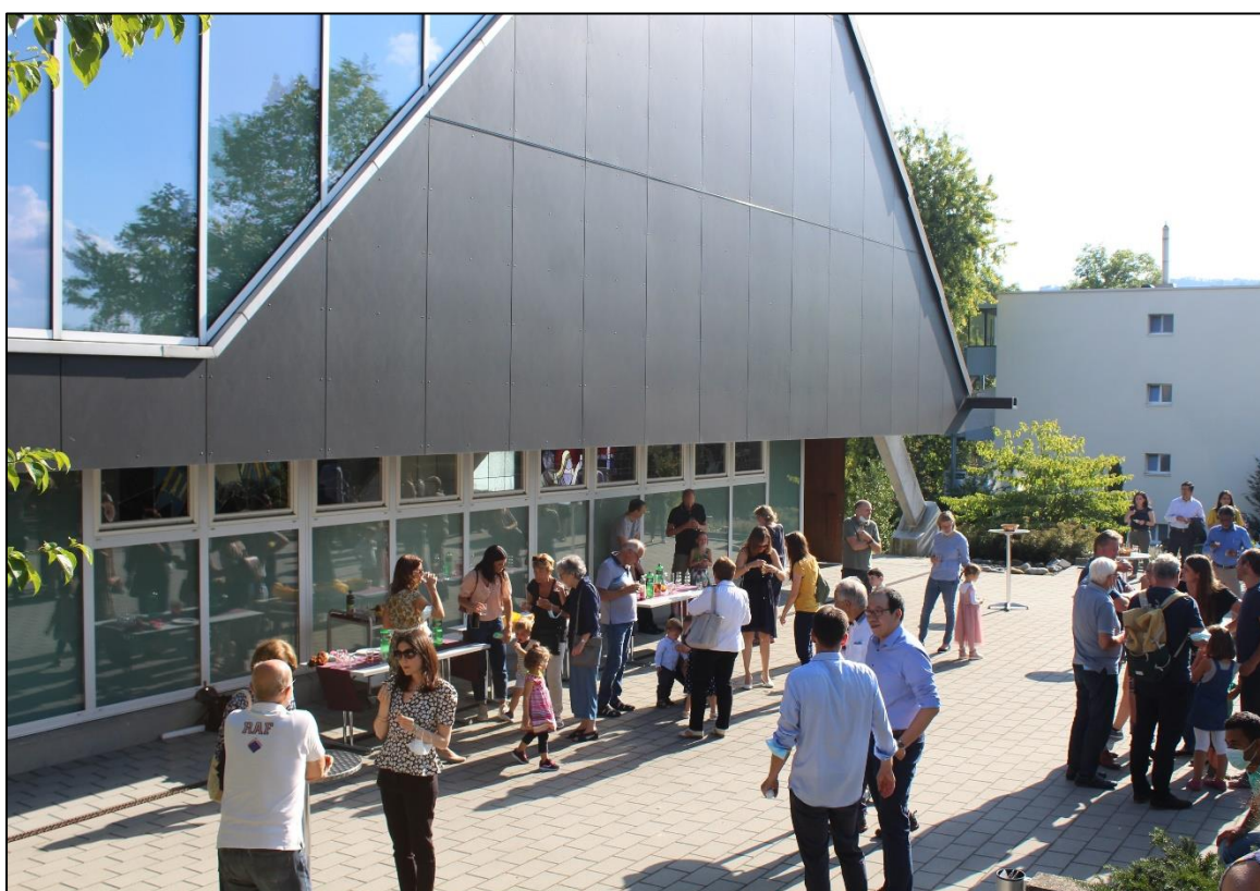
Apéro nach der Taferinnerungsfeier im September 2021