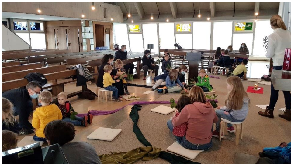
Fyre mit de Chlyne zu Palmsonntag 2021: Masken tragen und Abstand halten

Die Zahl der Mitfeiernden im Fyre mit de Chlyne bewegt sich auf dem Niveau von 2019. Corona hat die Zahl der Mitfeiernden nicht beeinflusst (zwischen 18 und 32 Teilnehmenden). Im Februar fand eine Feier online statt, ab April waren die Gottesdienste wieder physisch. Die Taufferinnerungsfeier im September wurde im 2021 für zwei Jahrgänge durchgeführt (2018 und 2019), erstmals mit Anmeldung. 55 Personen nahmen teil. Die Kleinkinderfeier an Weihnachten fand statt mit 11 Teilnehmenden. Sie fiel in eine Phase, wo sich viele Kinder mit Corona ansteckten und der Aufruf erging, die Zahl der sozialen Kontakte zu reduzieren.