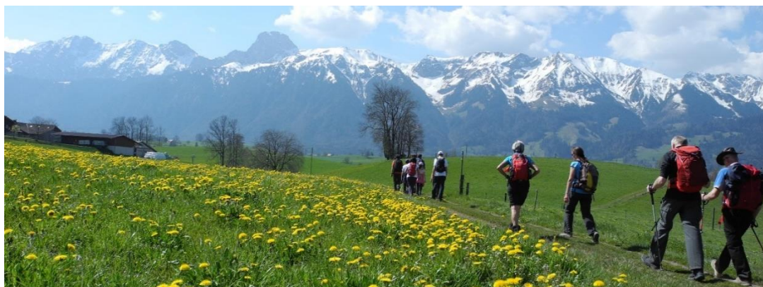
Auf der Pfarreiwallfahrt nach Amsoldingen im April 2021