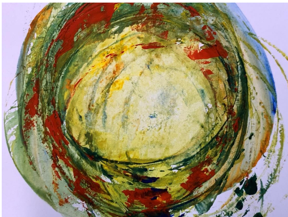
Die Schüler*innen der 5. Unterrichtsklasse haben für die Senior*innen Osterkarten gemalt.