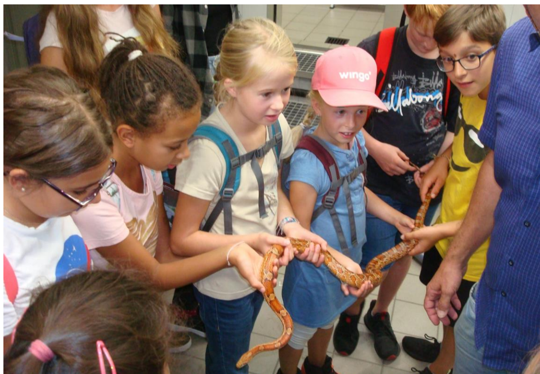
Auf der Minireise bei der Führung im Vivarium des Basler Zoos.

7 neue Minis stiessen zur Schar und somit besteht die Schar zurzeit aus 23 Minis. Die Mini-Reise im September führte in den Basler Zoo.