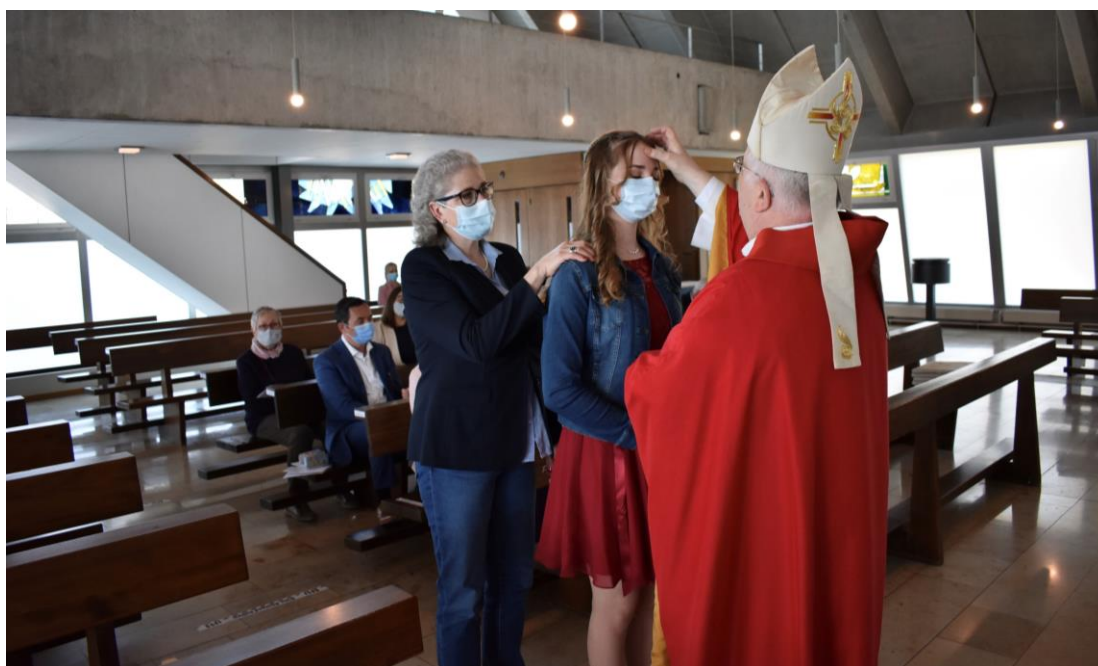
Die Firmungen 2021 im April – mit Abstand und mit Schutzmasken